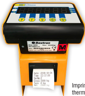
Imprimante papier thermique